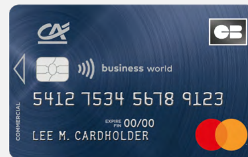
Carte Mastercard Business World*

* En circulation à partir de Septembre 2024