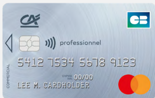
Carte Mastercard Professionnel